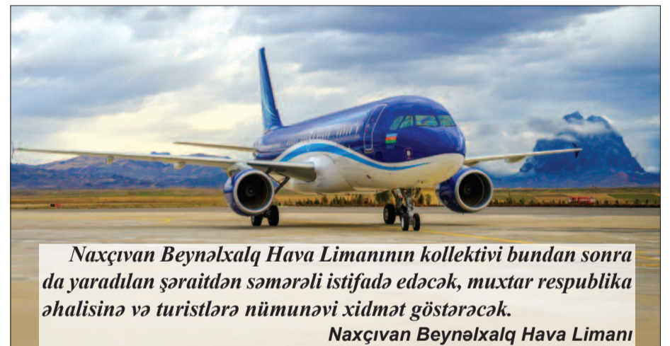
Naxçıvan Beynəlxalq Hava Limanının kollektivi bundan sonra da yaradılan şəraitdən səmərəli istifadə edəcək, muxtar respublika əhalisinə və turistlərə nümunəvi xidmət göstərəcək. Naxçıvan Beynəlxalq Hava Limanı

Beynəlxalq Mülki Aviasiya Təşkilatının qəbul etdiyi qərara əsasən 2019-cu il avqust ayının 15-dən Naxçıvan Muxtar Respublikasına Türkiyə