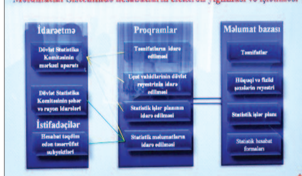
Naxçıvan Muxtar Respublikası Dövlət Statistika Komitəsinin Statistik Məlumatlar Sistemində hesabatların elektron qəbulması və işlənməsi

qatına dair seçmə statistik müayinələr keçirilmiş, sənaye müəssisələrində mövcud olan istehsal avadanlıqlarının vəziyyəti və onlardan istifadəyə dair statistik müayinələrin keçirilməsi ilə bağlı tapşırığın icrası istiqamətində müvafiq proqram təminatı hazırlanmış və Statistik Məlumatlar Sistemində yerləşdirilmişdir. Bu sahədə statistik müayinələrin keçirilməsinə aprel